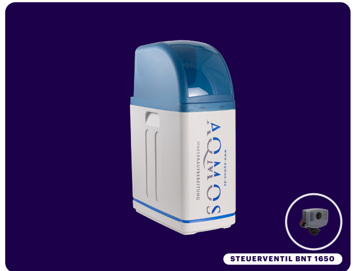
STEUERVENTIL BNT 1650